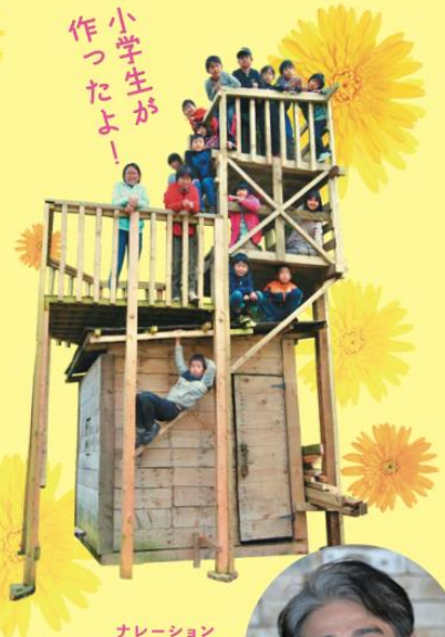
ナレーション 吉岡秀隆