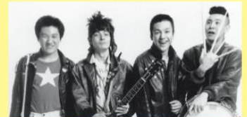
エンディングテーマ ザ・ブルーハーツ

あなたの町でも「夢みる小学校」を上映しませんか? お申し込みは、まほろばスタジオ▶